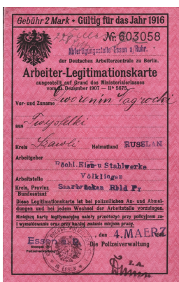
"Arbeiter-Legitimationskarte" d'un travailleur forcé russe, 1916