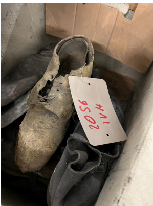
Chaussure de travail

Initiative Völklinger Hütte, Europawerkstatt