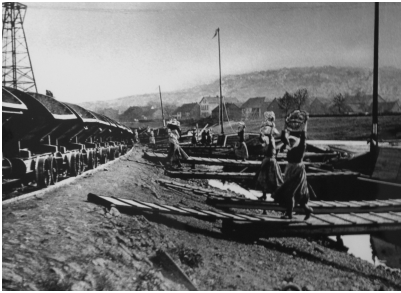
Des femmes, appelées « Erzengel » (archanges), chargent du minerai dans des wagonnets pour l'usine sidérurgique de Völklingen (vers 1900)