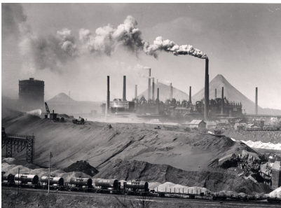
Vue d'ensemble de la Völklinger Hütte avec les terrils de laitier, 1956