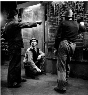
Réunion de travail au niveau de la coulée du haut fourneau, 1954