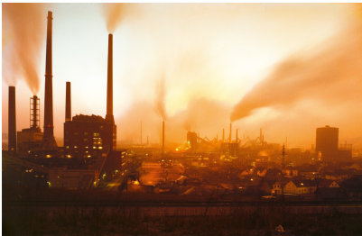
« Sintersonne » (soleil du frittage ou soleil voilé): La Völklinger Hütte en période d'activité