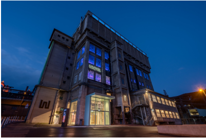
Der Wasserhochbehälter des Weltkulturerbes Völklinger Hütte