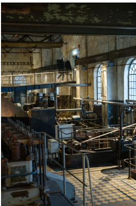
Steg über die Maschinen im Pumpenhaus