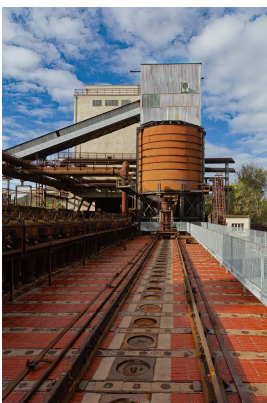
Blick auf den Kohleturm