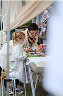
Workshop der Kunstschule Kassiopeia im Weltkulturerbe Völklinger Hütte