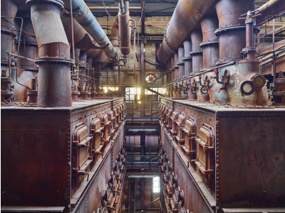
Die Trockengasreinigungen, Innenraum der TGR II