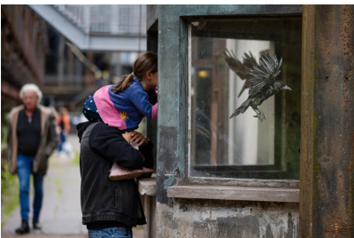
In der Kokerei