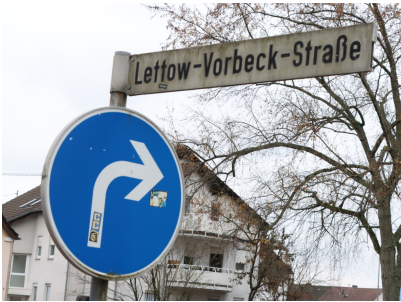
Lettow-Vorbeck-Straße à Völklingen

Elle se trouvait en 1919 sur le grand terrain de manœuvre de Sarrebruck.