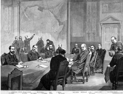
Dessin des participants à la conférence de Berlin, 1884