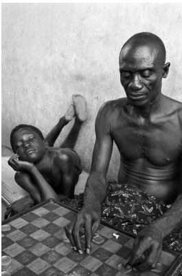
Robert Lebeck, Ashanti-Mann mit seinem Sohn beim Brettspiel, Ghana 1960