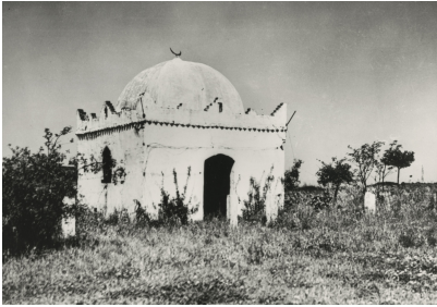
Une mosquée pour les soldats marocains des troupes d'occupation françaises

Source : Allgemeine Illustrierte Zeitung, Adalbert von Rößler (+1922)