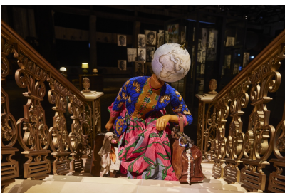
THE TRUE SIZE OF AFRICA, vue de l'exposition