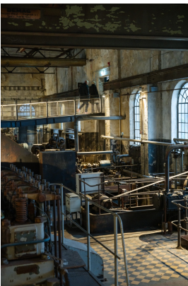
Passerelle au-dessus des machines dans la salle des pompes