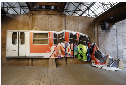
Moses & Taps, Anti-Graffiti-Folie