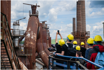
Die Aussichtsplattform über den Hochöfen