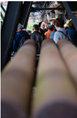
Hüttenführung im Weltkulturerbe