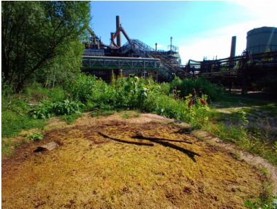
Julia Rabusai: Floor, 2021 ff.

Installation im Paradies des Weltkulturerbes Völklinger Hütte auf dem Gelände der ehemaligen Kokerei, aufgenommen 2021