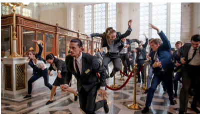
Julian Rosefeldt: EUPHORIA, 2022