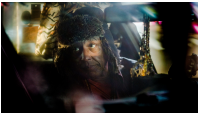
Julian Rosefeldt: EUPHORIA, 2022