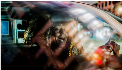
Julian Rosefeldt: EUPHORIA, 2022