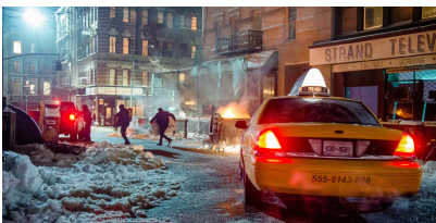
Julian Rosefeldt: EUPHORIA, 2022