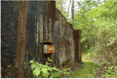
Blick auf den Leoparden-Pfad im Paradies